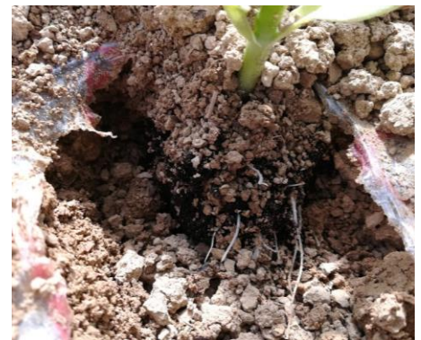
Enracinement d'un jeune plant

Le gel du 5 avril a engendré quelques pertes sur des parcelles. Les fréquences sont faibles.