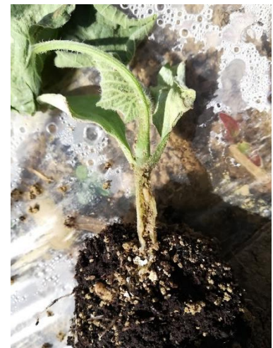
Larve de mouche des semis présente dans le collet.

Évaluation du risque : Le risque est faible à fort en fonction des parcelles. Les conditions fraîches, les situations de reprise lente des plants sont des conditions favorables à ces ravageurs. Le risque diminue quand la reprise des plants est plus rapide (durcissement des tissus du collet).