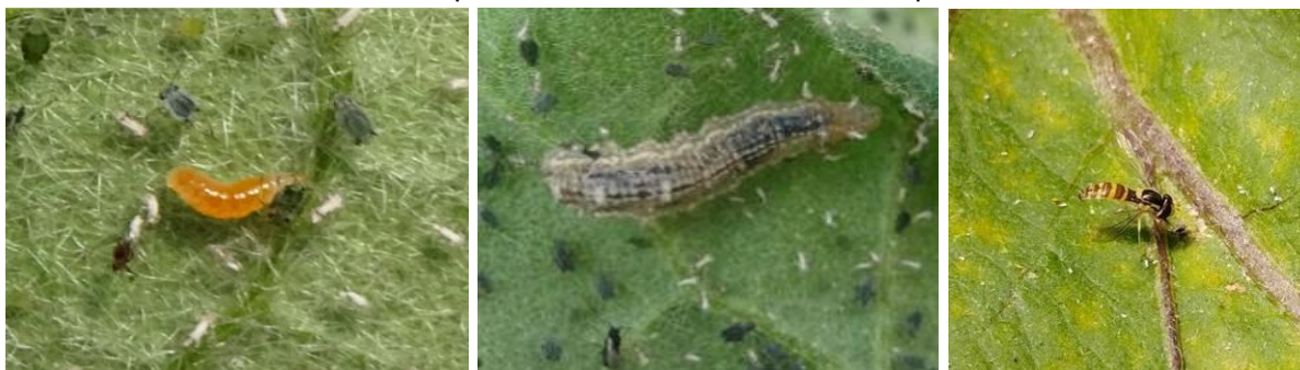
Larve d'Aphidoletes (cécidomyie) – Larve et adulte de syrphé

Chez ces espèces, seules les larves sont prédatrices des pucerons. Les adultes étant floricoles, il est important de favoriser leur installation pour assurer un bon niveau de prédation.