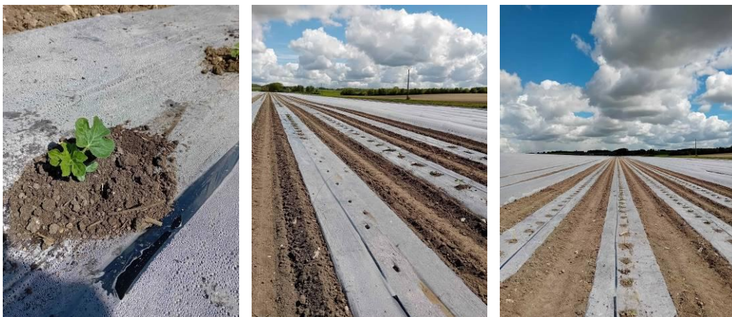
Chantier de plantation de pastèques

Bien que la plante et la culture de la pastèque présentent des similitudes avec celles du melon, les problématiques sanitaires qui y sont associées sont assez différenciables et semblent moins nombreuses.