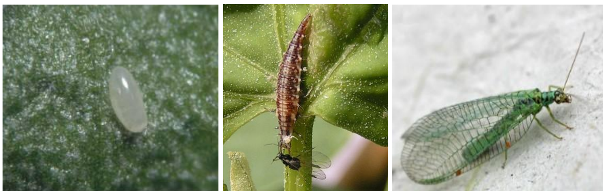
Œuf d'hémérobe – Larve de Chrysoperla carnea – Adulte de Chrysopa perla

Ennemis naturels des pucerons, les chrysopes et hémérobés sont des alliés efficaces pour réguler les populations de nombreux ravageurs de culture (pucerons, cochenilles, acariens, ...).