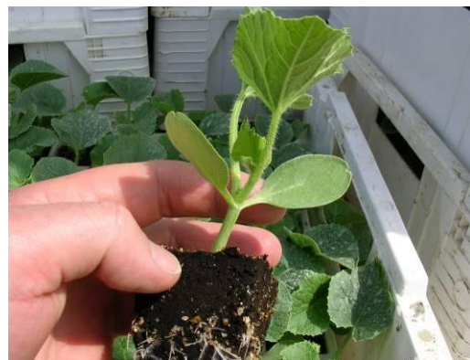
Un plant trapu, durci et jeune : gage d'une bonne reprise