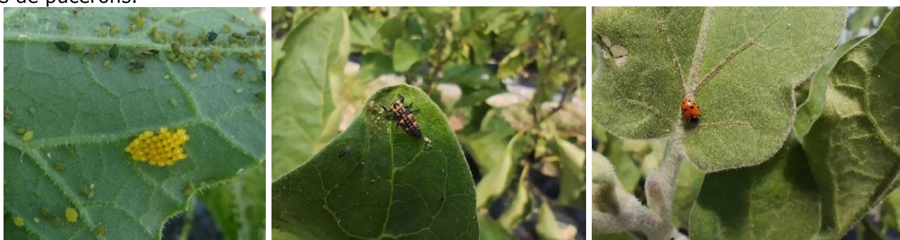
Ponte de coccinelle – Larve de coccinelle à 7 points – adulte de coccinelle à 7 points

De nombreuses espèces de coléoptères sont prédatrices des pucerons, notamment chez les coccinelles et les Scymninae. Les larves sont très voraces et les adultes pondent leurs œufs à proximité immédiate des foyers de pucerons.