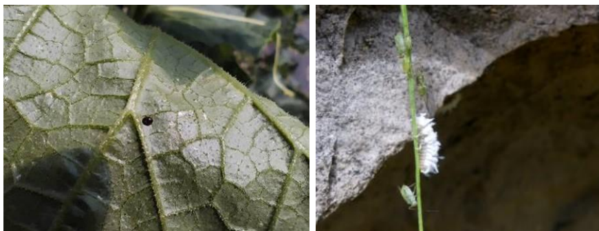
Adulte de Scymninae – Larve de Scymnus sp.