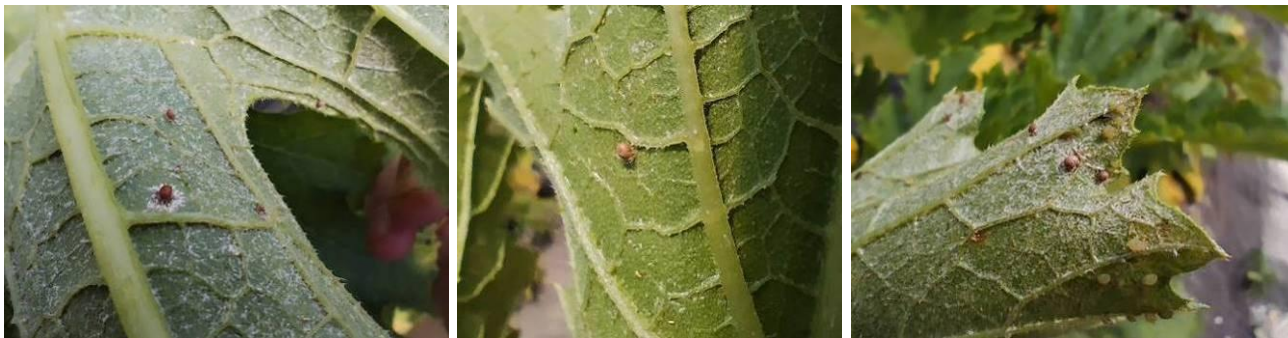
Momie de pucerons

Leur observation directe est difficile mais il est aisé d'observer leur activité : Les momies sont des pucerons parasités dans lesquels une larve d'hyménoptère va ou a émergé. Les principales espèces sont : Aphelinus abdominalis , Aphidius colemani , Aphidius ervi , Aphidius matricariae ou encore Praon volucre .