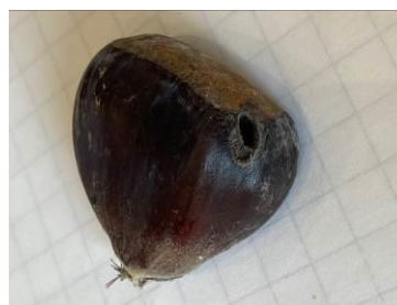
Trou de sortie de la larve de tordeuse à la récolte