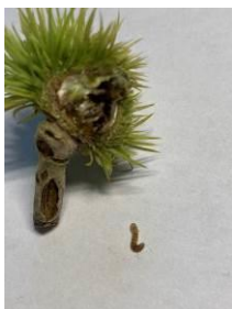
Jeune bogue infestée chutée au sol début août.