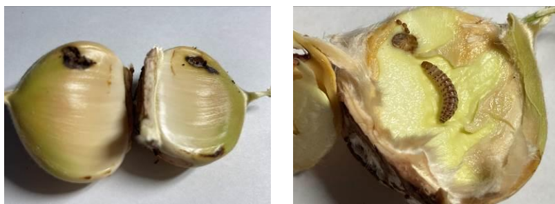
Bouche de Bétizac - Attaque de deux châtaignes dans une bogue – Présence d'une larve de la tordeuse. Allasac en Corrèze, le 9/08/2022

Attaques des châtaignes par les larves de tordeuses visibles.