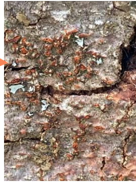
Pustules rouge-orangées : fructifications du champignon