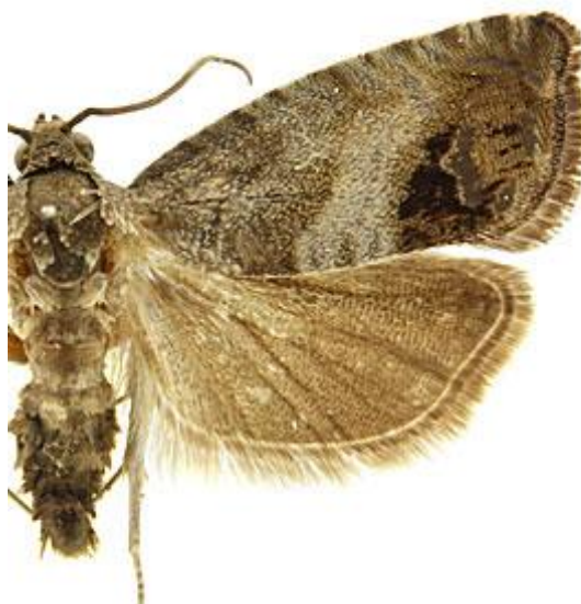
Adulte mâle de Cydia splendana (carpocapse) →