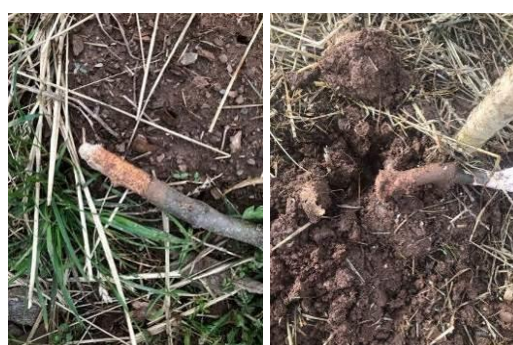
Dans le Cantal

Dégâts de campagnols terrestres sur le système racinaire de jeunes plants de châtaigniers.