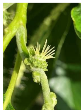
Marigoule BBCH 65f