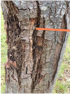
Chancre sur tronc