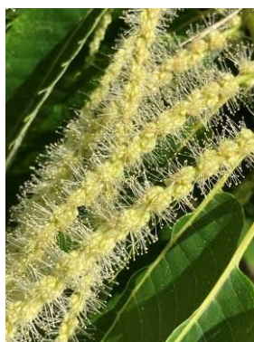
Marigoule BBCH 60m

Tous les secteurs : Stades BBCH 65f – 60 à 65m : pleine floraison !