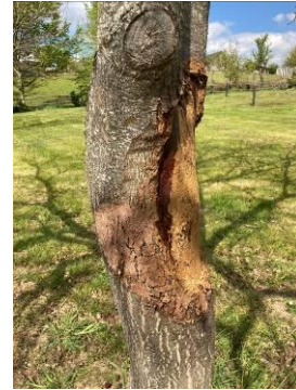
Chancre cureté avec bourrelet de cicatrisation en périphérie