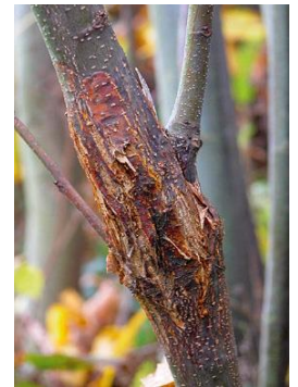
Chancre avancé, sur bois jeune

Sur des arbres plus âgés, la détection est moins visible : l'écorce se craquelle de façon longitudinale et se boursoufle.