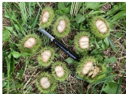
Marigoule 2,4 fruits/bogue

Glandon (87), 31 août 2023.