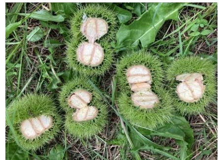
Bouche de Bétizac 2,4 fruits/bogue

Chutes importantes de bogues vides de Marigoule observées dans le Nord du Bassin Sud-Ouest. Mais il reste beaucoup de bogues sur les arbres ! Début d'éclatement des bogues de Bouche de Bétizac et de coloration dans le Sud du Bassin de production (Dordogne, Lot, Lot et Garonne). Bonne nouaison sur les deux variétés principales.