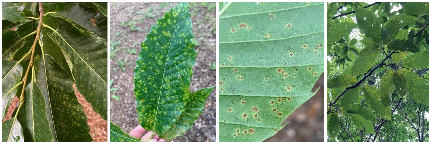
Symptômes de septoriose sur Bouche de Bétizac et Marigoule

Mais à ce jour, pas de chute de feuilles importantes observée pouvant mettre en péril de grossissement des bogues voire leur chute prématurée.