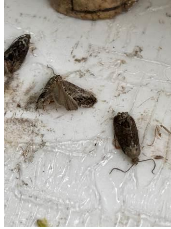
Piégeage des papillons de carpocapses. 2 formes d'adultes : sombre et gris argenté