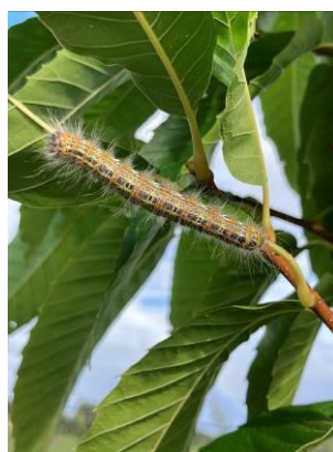
Chenille Bucéphale sur feuilles de châtaigniers Glandon – 8 septembre 2022

La larve fait sa nymphose dans le sol superficiellement. La forme adulte est un papillon marron. Après l'accouplement la femelle dépose des amas d'œufs sur la face inférieure des feuilles.