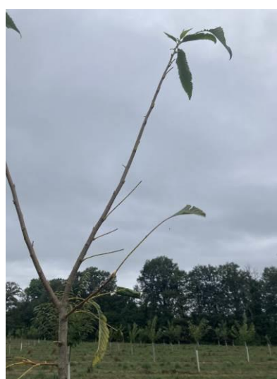
Défoliation par la chenille bucéphale – Jeunes arbres de 3 ans. La Meyze (87) – 3 septembre 2024