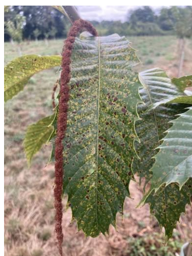
Début de contamination sur Bournette (fin juin 2024)