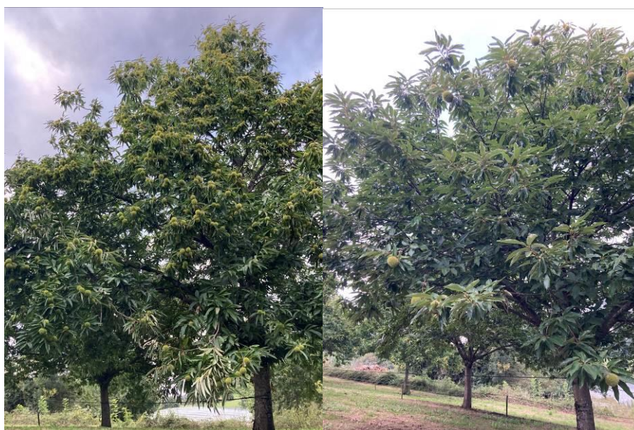
Bournette chargée (à gauche), Bouche de Bétizac peu chargée (à droite)

Verger irrigué à Allasac (19), le 17/09/2024