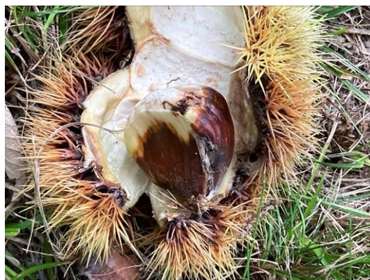
Dégâts de larves de tordeuses sur Bouche de Bétizac