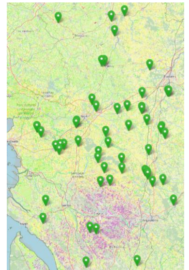
Réseau de parcelles de blés et d'orge d'hiver