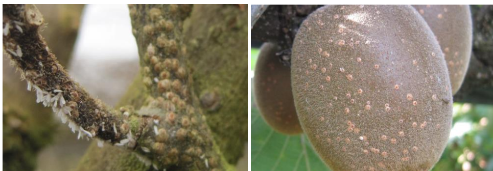
Encroûtement et follicules mâles de cochenille blanche du mûrier sur bois et boucliers sur fruits

En parcelles infestées, elle envahit les charpentières et forme d'épais encroûtements blanchâtres. Elle peut rapidement provoquer le dépérissement des branches colonisées.