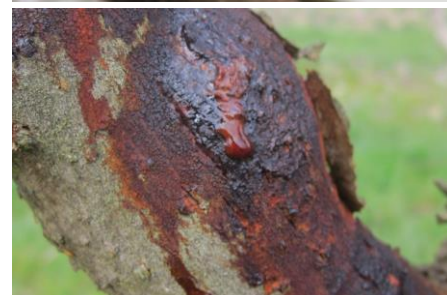
Écoulements d'exsudat blanc et rougeâtre (hiver, début printemps)