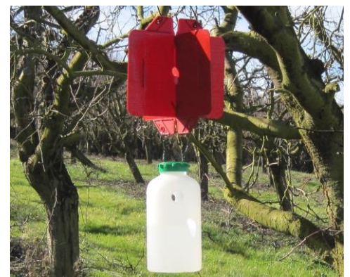
Piège à xylébore

Si un suivi de ce ravageur est nécessaire, la mise en place des pièges est à prévoir à partir de la deuxième quinzaine de février et de préférence en périphérie de la parcelle. Dans les situations à forte pression, il est possible de recourir au piégeage massif en installant 8 pièges par hectare.