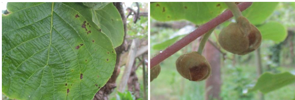
Nécroses sur feuille et nécroses sur boutons

Des taches sur feuilles (taches nécrotiques avec halos jaunes) et nécroses sur boutons sont observées sur certaines parcelles ainsi que des dessèchements de végétation suite aux exsudats sur bois. On note peu ou pas d'évolution des symptômes sur feuilles.