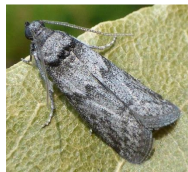
Ectomyelois ceratoniae

Vous pouvez accéder à davantage de photos en consultant ce lien : http://lepiforum.org/wiki/page/Apomyelois_Ceratoniae .