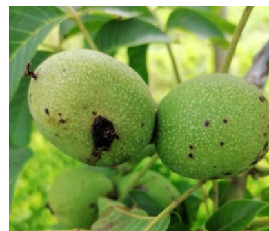
A gauche, dégât de larve de carpocapse

Concernant les observations en parcelle, peu de dégâts de la 1 ère génération ont été observés dans la plupart des situations, même si de rares vergers présentent plusieurs noix véreuses.