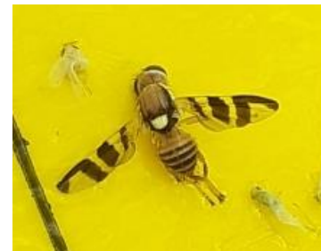
Rhagoletis completa

En secteurs plus intermédiaires, une hausse des piégeages est en cours depuis peu.