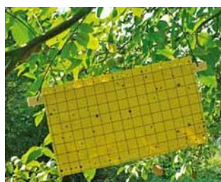
Plaque piège pour la mouche du brou