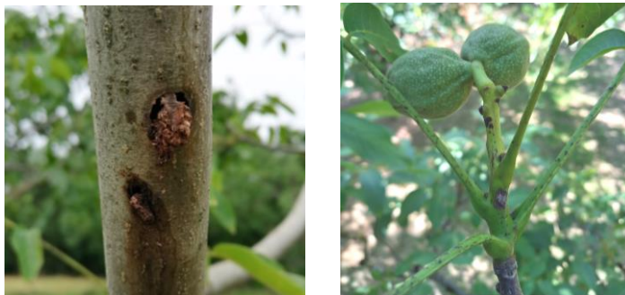
Dégâts de larves de zeuzère sur branche et sur pousse

Les orifices de pénétration des larves sont marqués par de petits tas de sciure et d'excréments (en forme de petits cylindres) accompagnés d'écoulement de sève, particulièrement visibles sur les branches.