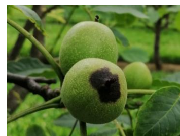
Symptôme de bactériose

Parfois, un développement d'anthracnose à Colletotrichum sp. est suspecté sur les taches apicales dues à la bactériose puisqu'elles finissent par se crevasser.