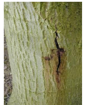
Chancre vertical sur noyer