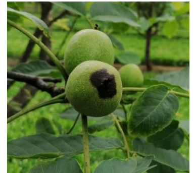
Nécrose apicale sur brou due à la bactériose

Les symptômes apparaissent sur le limbe des feuilles, sous forme de ponctuations éparses, noires, entourées d'un petit halo translucide. Des chancres se développent sur les jeunes pousses et provoquent leur dessèchement. Des ponctuations d'abord translucides se développent sur le brou des jeunes noix après la nouaison, puis s'étendent plus ou moins en larges taches noires entraînant la chute des fruits.