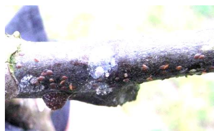
Larves de Lécanine du cornouiller et bouclier protégeant une femelle.

La cochenille adulte pond de très nombreux œufs (150 à 200) sous son bouclier. Après leur éclosion, les larves se déplacent entre fin mai et fin juillet vers les jeunes branches, les pousses et les jeunes feuilles sur