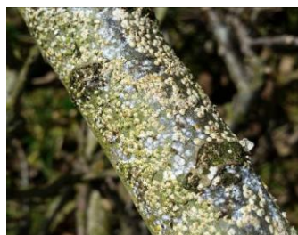
Boucliers blancs cachant les femelles

La présence de femelles hivernantes sous les boucliers blancs peut être repérée sur des charpentières.