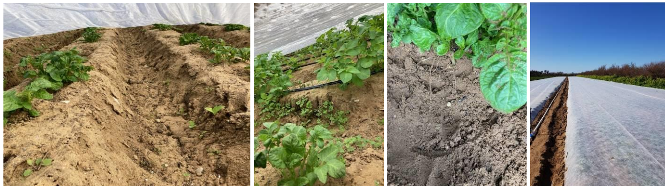
Cultures sous chenilles et sous bâches

De même, comme en 2022, les conditions sèches n'ont pas été favorables à la réussite des stratégies de désherbage. Ainsi, pour de nombreuses parcelles enherbées, il a été nécessaire d'enlever les bâches de protection, d'effectuer un désherbage (rattrapage ou mécanique ou manuel) et ensuite de repositionner les bâches pour protéger la culture (gelées, maintien de la précocité...).