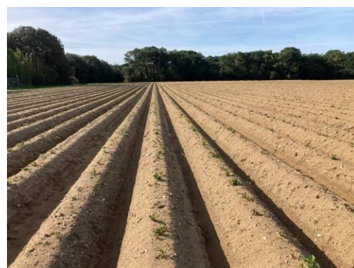
Levée des cultures de plein-champ

Les plantations d'ALCMARIA (variété « très primeur ») ou de PRIMABELLE sont terminées et les premières parcelles plantées sans bâches sont en cours de levée. Pour la variété CHARLOTTE (variété de « cœur de saison »), les plantations vont se poursuivre jusqu'à la fin du mois (ou jusqu'à tout début d'avril).