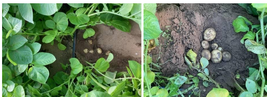
Sous tunnels, stade grossissement

Pour ce type de production, les conditions ont été relativement favorables à un développement foliaire correct (rayonnement important) et à une tubérisation rapide. Les premiers arrachages devraient débuter d'ici deux semaines.