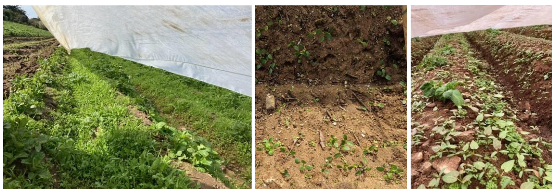
Des enherbement souvent importants

Comme en 2022 et comme évoqué précédemment, les conditions sèches n'ont pas permis une efficacité correcte des stratégies de désherbage. De nombreuses parcelles sont fortement enherbées, à très fortement enherbées (renouées liseron, véroniques, séneçon... et même du datura sous bâches).