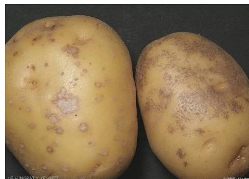
Taches caractéristiques de gale argentée