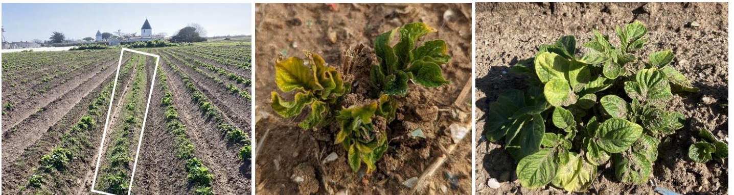
Enherbement sur un rang « non couvert » – De nombreux cas de phytotoxicités herbicides (jaunissements marqués)

Contrairement aux années précédentes (avec des sols secs) les stratégies de désherbage présentent « une efficacité correcte », peu de parcelles présentent des levées importantes d'adventices. Cependant, les conditions humides conduisent à de fréquentes phytotoxicités à la levée (jaunissements marqués illustrés sur les photos ci-après).