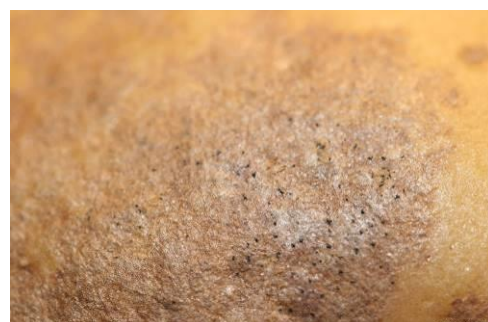
Taches brunes diffuses avec ponctuations noires