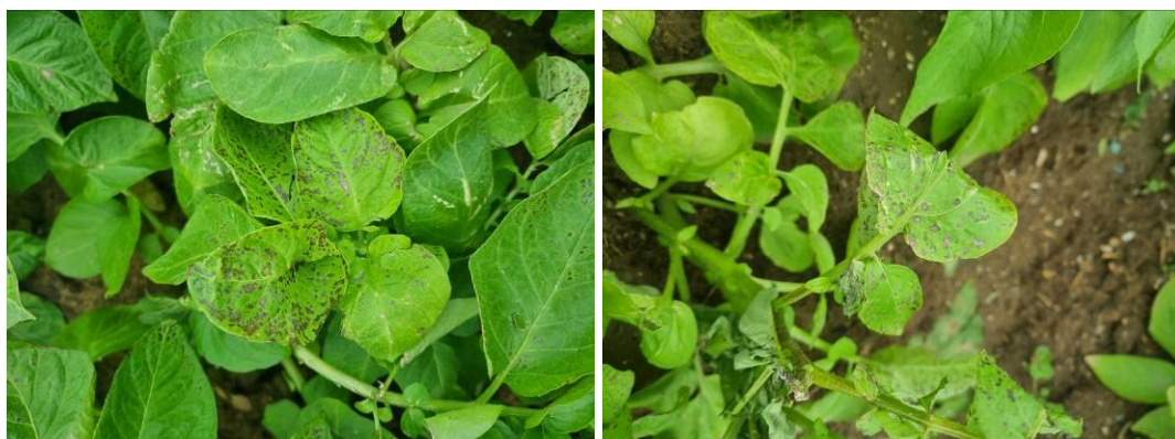
Symptômes d' Alternaria observés sur une variété en essai

Évaluation du risque : à ce jour, présence notée uniquement sur une nouvelle variété qui s'avère très sensible. Le risque est cependant présent, à surveiller sur une variété sensible comme Charlotte.