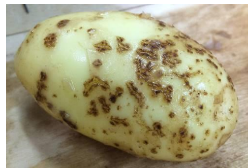
Symptômes typiques de gale commune