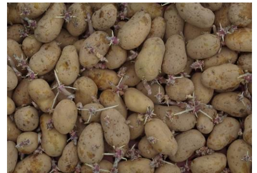
Production primeur : l'importance de germes solides

Contrôler l'état sanitaire de vos plants de pommes de terre en réalisant des observations sur une cinquantaine de tubercules par lots. Après lavage, observer les maladies potentiellement présentes sur les tubercules comme la gale argentée, la dartrose ou le rhizoctone. Puis couper les plants pour vérifier l'absence de pourritures.