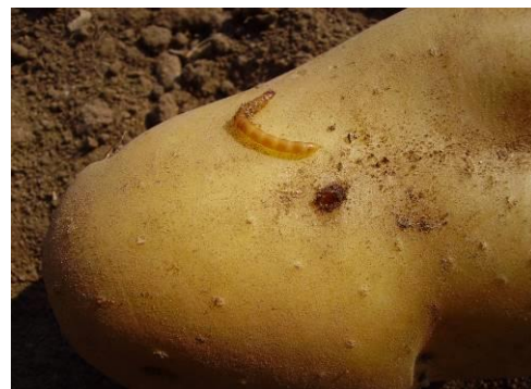
Larve de taupin (début de perforation d'un tubercule)

Pour évaluer le risque dans une parcelle, vous pouvez, avant la plantation, couper quelques pommes de terre en deux et les mettre sur le sol face coupée sur la terre, et observer alors les quantités d'individus. Sinon, la mise en place d'un piégeage à base d'appâts enfouis est possible, mais plus complexe à mettre en œuvre.