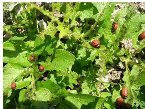
Larves de doryphores en pleine consommation des feuilles (stade L3 et L4)

La durée du cycle de vie de l'œuf à la formation d'adultes en été est très variable et dépend des températures d'été : elle dure environ un mois au cours d'étés chauds, mais peut durer 2 à 3 mois, si les températures sont plus fraîches. Par conséquent, la température a un effet direct sur le nombre de générations formées annuellement et selon le climat, une à quatre générations peuvent être formées chaque année