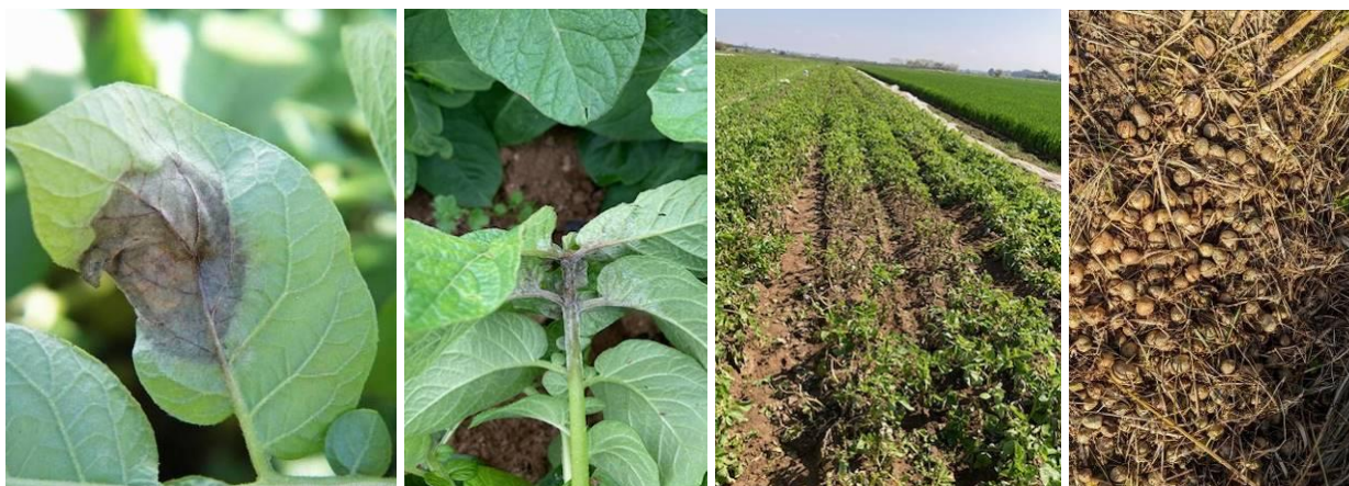
Taches sur feuilles et sur pétioles - Foyer de mildiou - Tas de déchets en bord de champ, point de départ de 1 ère contaminations

Attention de ne pas épandre les tas de déchets sur les parcelles, il sera plus difficile de gérer les repousses vis-à-vis du mildiou mais également des autres pathogènes susceptibles d'être présents dans la terre (rhizoctone, ...).