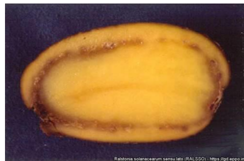
Pourriture interne du tubercule