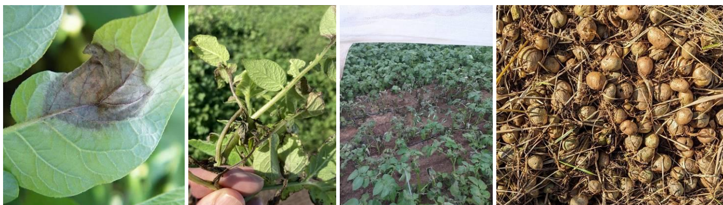
Taches et foyers de mildiou observés « mi-mars » – Tas de déchets à l'origine d'un foyer (repousses gérées depuis)

De premières taches de mildiou ont été observées dès la première décade de février sous deux tunnels. La recherche d'une source d'inoculum a permis d'identifier un tas de déchets présentant des symptômes. Ce tas de déchets « a été géré » de façon qu'il ne soit plus une source d'inoculum pour de prochaines contaminations.