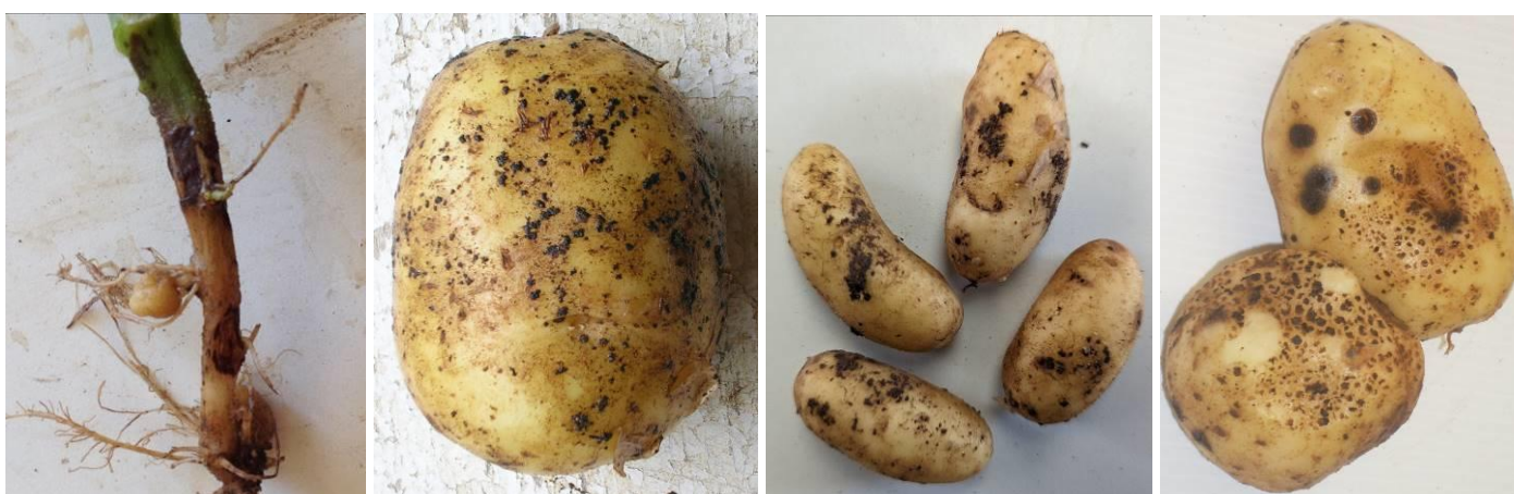
Différentes manifestations de Rhizoctone brun sur plante et tubercules