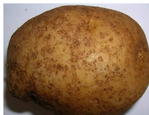
Piqûres sur l'épiderme des tubercules

Dans le cas de parcelles fortement contaminées, les femelles adultes peuvent être visibles à l'œil nu pendant la végétation sous forme de petites boules (kystes) de très petite taille (0,5 à 1 mm) attachées aux racines de la plante. Selon l'espèce de nématode, la couleur de ces kystes est d'abord jaune pâle puis jaune doré chez Globodera rostochiensis , blanche chez Globodera pallida avant de devenir brune.