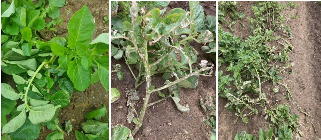
Tige cassée par le vent et feuillage abimé par la Grêle

De même, le vent parfois tempétueux (rafales) entraîne des casses de tiges (cf. photo ci-après).