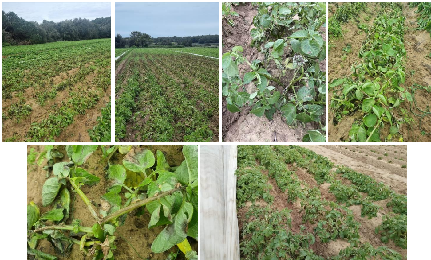
Sur plusieurs communes, de nombreux foyers

Rappel des conditions de développement du mildiou : les contaminations et l'évolution de la maladie dépendent des températures et de l'humidité. Ainsi, les conditions climatiques idéales pour le développement du mildiou sont d'abord une succession de périodes humides et assez chaudes (un optimal de 18-22°C) pour la formation des spores. La germination des spores est ensuite possible dès que la durée d'humectation du feuillage est égale à 4 heures et plus, assortie de températures comprises entre 3-30°C (optimal 8-14°C). Par la suite, les pluies, les hygrométries supérieures à 90 % associées à des températures comprises entre 10-25°C favorisent l'évolution de la maladie. En revanche, des températures négatives (-2°C) ou bien à l'inverse celles supérieures à 30°C limitent ou bloquent le développement du champignon.