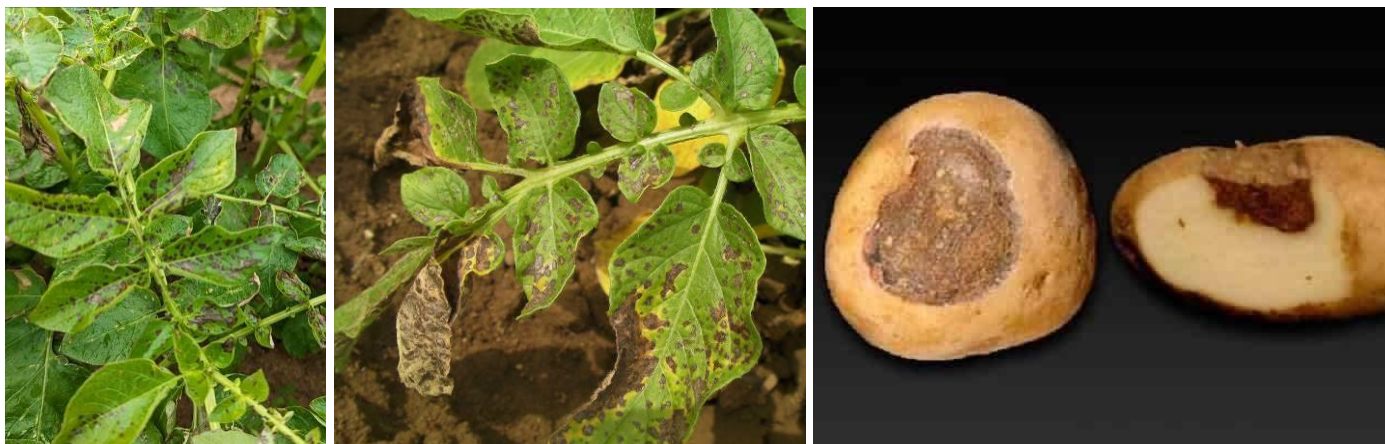
Alternaria sur plantes, sur tubercules