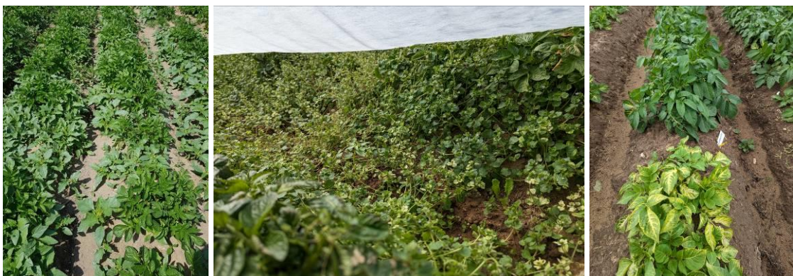
Des enherbements régulièrement importants (plein-champ ou sous bâche) - Une variété particulièrement sensible à un herbicide

Pour les implantations précoces (cultures bâchées), les conditions sèches n'ont pas permis une efficacité correcte des stratégies de désherbage. Ainsi, de nombreuses parcelles sont enherbées. Pour ces parcelles, la réalisation du désherbage mécanique est particulièrement complexe, car elle conduit à la nécessité de retirer la bâche, à effectuer l'intervention mécanique, puis à repositionner manuellement les bâches (dans un contexte régulièrement venteux). Par ailleurs, on peut noter dans quelques parcelles de plein-champ des phytotoxicités herbicides (des jaunissements, des blanchiments). On note une forte sensibilité variétale (cas de Primabelle et d'une variété en essai).