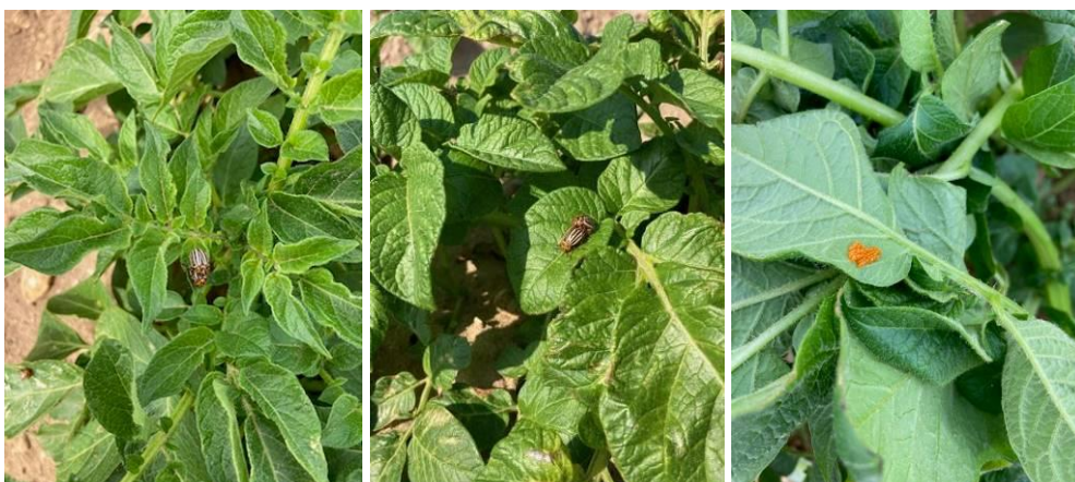
Présence d'adultes et premières pontes