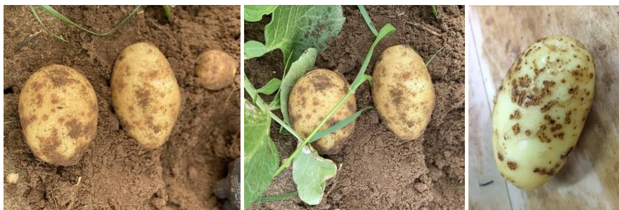
Symptômes de gale commune sur l'Île de Ré

Généralement, les altérations liées à la gale commune sont rares dans le contexte de l'Île de Ré. Mais, cette année comme en 2022, des parcelles en cours de récolte présentent des symptômes significatifs.