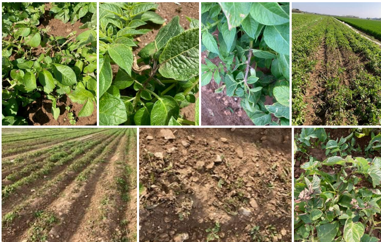
De nombreux foyers observés ce 24 avril

La situation n'est pas stabilisée (des foyers sont actifs) et les conditions humides annoncées vont favoriser l'extension de ce champignon.