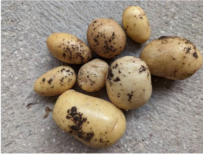
Dégâts liés à la présence de rhizoctone

Secteur primeur de l'Ile de Ré : avec l'allongement de la durée des tubercules dans le sol, le champignon occasionne des pertes significatives sur certaines parcelles et jusqu'à des difficultés de tri sur la chaîne de conditionnement. Les taux de déchets sont variables d'une parcelle à l'autre, sans toujours disposer de facteurs explicatifs. Les dégâts sont en progression.