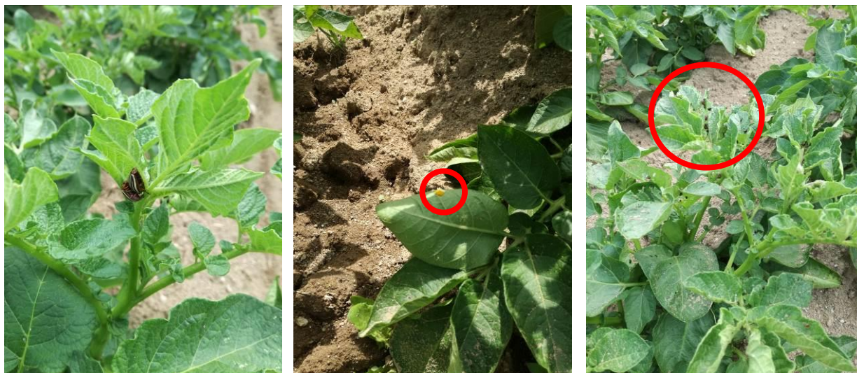
Adultes en phase d'accouplement, ponte et larves « grain de riz »

Secteur limousin : des doryphores sont observés dans toutes les parcelles du réseau et même hors réseau. Pour les parcelles infestées tardivement, la pression se limite à quelques adultes, mais pour la plupart des larves sont repérées et consomment les feuillages. Les dégâts sont plus ou moins importants selon les situations et le stade des larves.