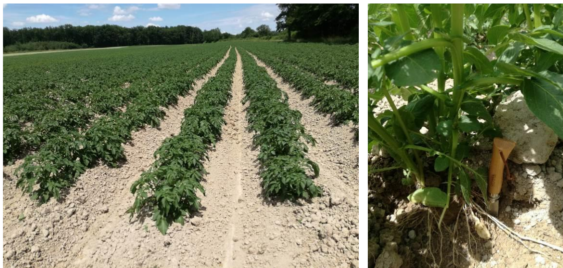
Aperçu des cultures en Creuse

Le réseau s'appuie cette année sur neuf parcelles « fixes » situées sur le territoire limousin, débordant même sur les départements de la Vienne et de la Charente afin de mieux couvrir la zone de production de plants. Sur ces parcelles du réseau, les cultures évoluent entre les stades « formation de pousses latérales basales » (BBCH 25) et « pleine floraison » (BBCH 65). La plupart des pommes de terre sont en fleurs. Celles qui ne le sont pas ne vont plus tarder à l'être au vu des bourgeons floraux.