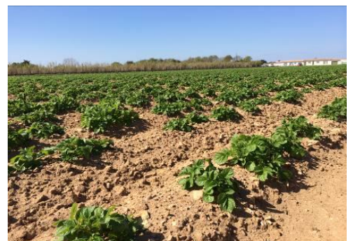
Cultures de plein-champ

Les plantations des cultures « de saison » avec la variété Charlotte viennent de se terminer. Les stades de développement sont variables suivant la date de plantation et la situation des parcelles : de non levée à émission des stolons.