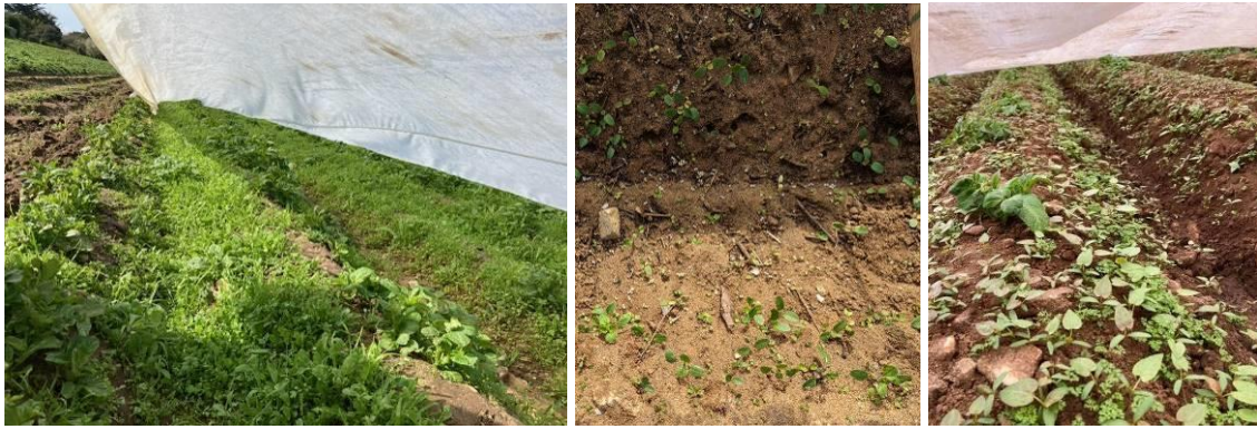
Rappel des enherbements notés au 20 mars