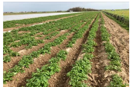
Cultures débâchée pour binage

De même, les conditions sèches n'ont pas été favorables à la réussite des stratégies de désherbage. Ainsi, pour de nombreuses parcelles enherbées, il a été nécessaire d'enlever les bâches de protection, d'effectuer un désherbage (rattrapage ou mécanique ou manuel) et ensuite de repositionner les bâches pour protéger la culture.