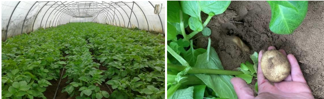
Production sous tunnels, des surfaces réduites et hors AOP

Les arrachages des productions sous abris débutent et seront relayés par les cultures sous arceaux.