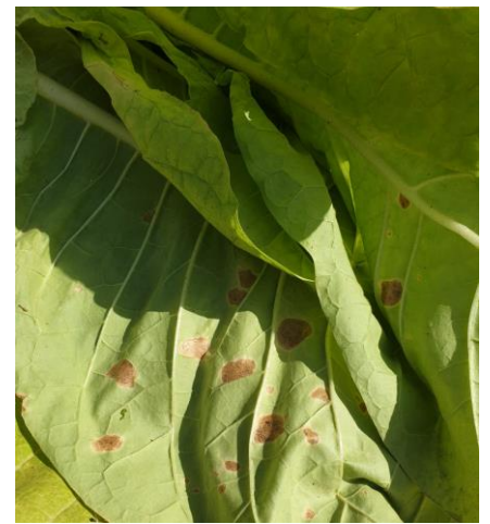
Mildiou sur feuille de tabac

Pour le tour de plaine, on signale des traces de mildiou sur 1 ha dans la région Occitanie. On l'observe aussi sur 15 ha pour le département de la Vienne (86). On note des dégâts de moins de 20% sur 6 ha en en Maine-et-Loire (49).