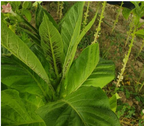
Pucerons sur feuille de tabac - (Crédit Photo : D. SAUREL – TGA)

En parcelles de référence, on observe des traces de l'ordre de 7% sur le secteur de Sanvensa (12). En tour de plaine, ils sont présents dans la région Occitanie sur 6 ha.