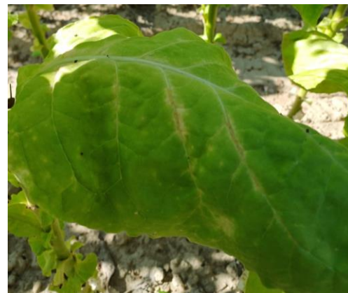
Thrips sur feuille de tabac

En parcelles de référence, on note leur présence dans le secteur de Sanvensa (12). En tour de plaine, on note des traces de thrips sur 2 ha dans la région d'Occitanie.