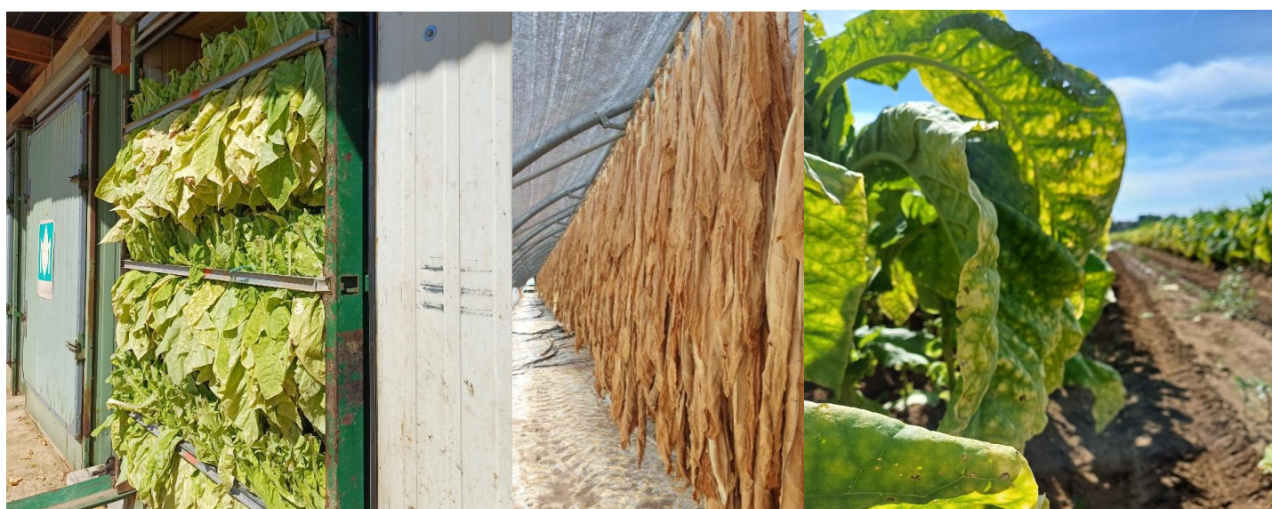
Virginie aromatique mis au four (à gauche), séchage tabac (au centre) et dernier passage Virginie aromatique (à droite)

Les récoltes sont de bonnes qualités et terminées dans de nombreux secteurs. On observe le début des effeuillaisons et un séchage en cours pour le Burley, Brun et Virginie. Pour les Hautes-Pyrénées (65), il reste environ 10 jours de récolte alors que pour le Lot-et-Garonne (47), on note que le séchage est en cours malgré les conditions un peu trop sèches. Fin de campagne qualitative pour les Virginie en Occitanie. Suite aux conditions climatiques de ces derniers jours, on observe dans la Vienne (86) la fin de la récolte avec une bonne qualité mais un rendement diminué par la présence du stolbur et de l'orobanche.