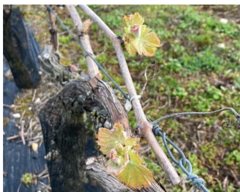
Cabernet franc, Ste Marie de Ré