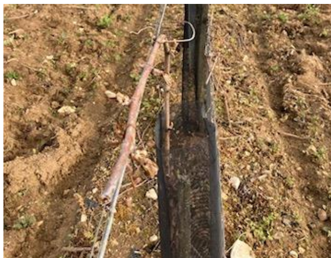
Bourgeons gelés sur Chardonnay sur l'Île de Ré