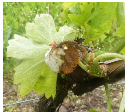
Nécrose bactérienne

Les bactéries sont émises en abondance dans les pleurs au moment des opérations de taille. Ces pleurs contaminent les bourgeons sains sur lesquels elles s'écoulent. Le vent et la pluie facilitent leur dissémination sur les ceps environnants. Un printemps froid et humide, ainsi que de fortes pluies d'automne sont des facteurs favorisant la propagation de la maladie.