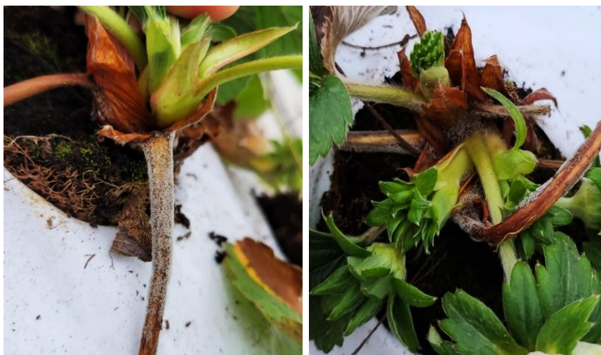
Botrytis de cœur sur Murano

- Lot-et-Garonne : Cette semaine, la fréquence d'observation a significativement poursuivi sa décroissance en passant à moins de 5 % de parcelles touchées. La prophylaxie de nettoyage des plants et la météo ont encore une fois permis cette diminution. L'intensité d'attaque de ce champignon parasite est donc faible dans ce secteur. Les reliquats secs des attaques antérieures se voient sur fruits primaires de Gariguette.