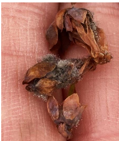
Botrytis sur fleurs de myrtillier

Les structures partenaires dans la réalisation des observations nécessaires à l'élaboration du Bulletin de santé du végétal Nouvelle-Aquitaine Petits fruits sont les suivants CDA 19, CDA 24, CDA 47, France FOOD, Fredon Nouvelle-Aquitaine, Fruidor, Koppert, Scaafel, VDL, Valprim-Rougeline, Cadralbret, ADIDA 19, Périgord Fruits, Invenio, Chloris Arbo SAS.