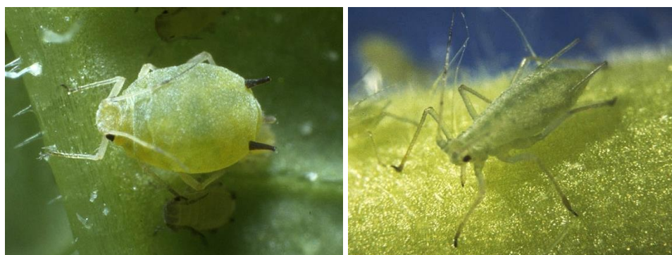
Pucerons Aphis (gauche) et Macrosiphum (droite) adultes sur fraisier

- Dordogne : Des traces de pucerons ont encore été relevées cette semaine (notamment en Murano). Leur présence peut être aussi bien généralisée que relevée sous forme de foyers. Néanmoins, leur fréquence semble tendre à diminuer.