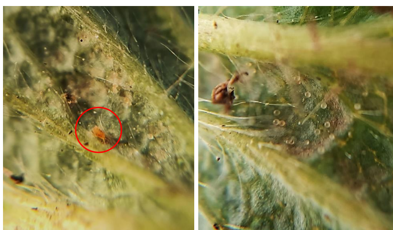
Larve et œufs d'acariens sur foliole

- Dordogne : On note également cette semaine la présence d'individus sur plus d'1/4 des ateliers surveillés avec une faible intensité d'attaque (moins d'1/4 de plants impactés sur les parcelles concernées).