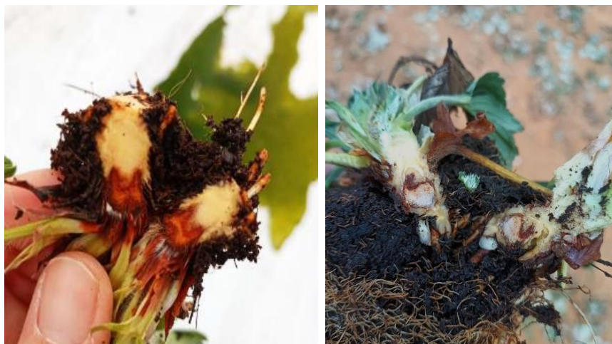
Nécrose non analysée (maladie de cœur) et Phytophthora cactorum sur cœur de fraisier

- Dordogne : Des symptômes de Phytophthora cactorum sont encore signalés dans ce secteur et essentiellement sur Murano et Gariguette. Seules quelques exploitations sont pour le moment concernées (<1/4) mais l'intensité d'attaque est quant à elle toujours assez élevée.