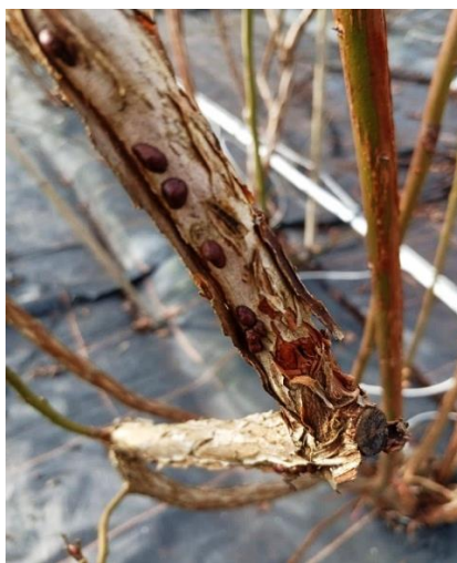
Essaimage de cochenilles bouclier sur tige de myrtillier (Crédit photos : M. CARMENTRAN-DELIAS – CDA47)

- Lot-et-Garonne : Des essaimages de cochenilles à bouclier ont commencé à être observés.