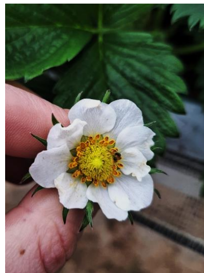
Larve de thrips, thrips adulte et dégâts sur fleurs