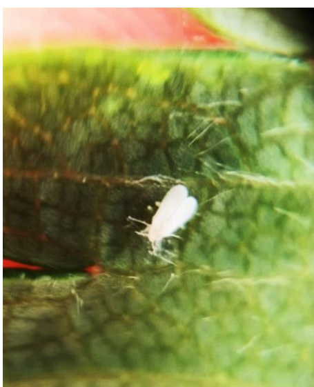
Aleurode adulte sur foliole