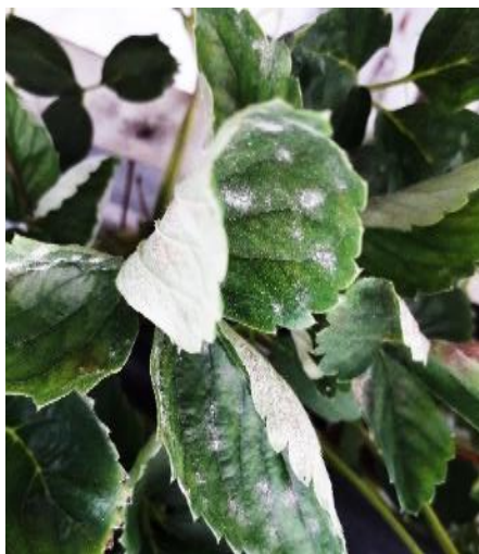
Symptôme d' oidium sur foliole

La fréquence d'observation est pour le moment très faible (<1/4).