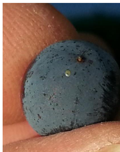
Ponte stade tête noire