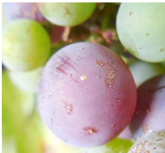
Ponte stade intermédiaire

L'observation des pontes et la détermination du stade des oeufs (stade tête noire) sont des éléments importants pour optimiser le positionnement d'une éventuelle protection.