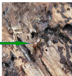
Insecte immature (4,5 à 6 mm)

Les photographies ci-dessous montrent la morphologie des adultes immatures ainsi que les galeries sous-corticales caractéristiques.