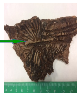
Galeries sous corticales