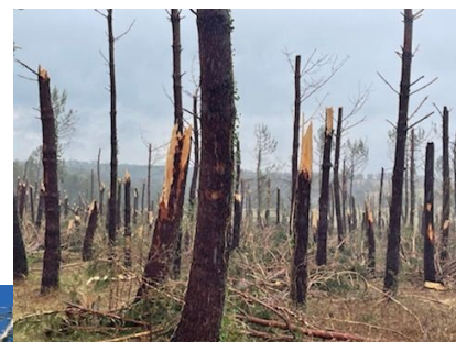
Impacts de grêle sur tronc, volis suite à l'orage du 20 juin sur le Nord Dordogne