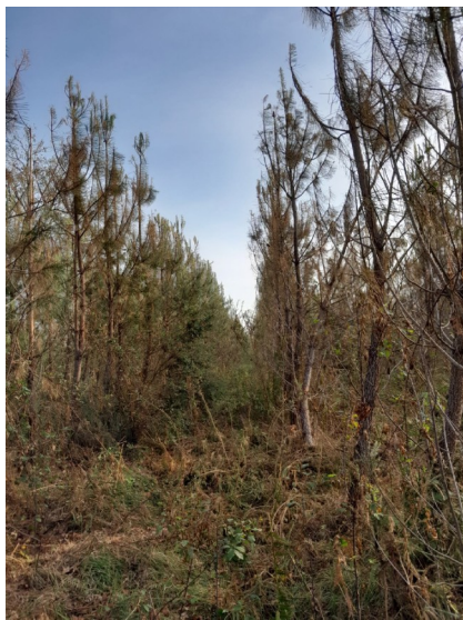
Rougissements de jeunes plantations de pin maritime consécutifs à la grêle du 3 juin 2022

Contact : DRAAF SRAL Pôle santé des forêts 51 rue Kieser 33077 Bordeaux cedex sral.draaf-nouvelle-aquitaine@agriculture.gouv.fr